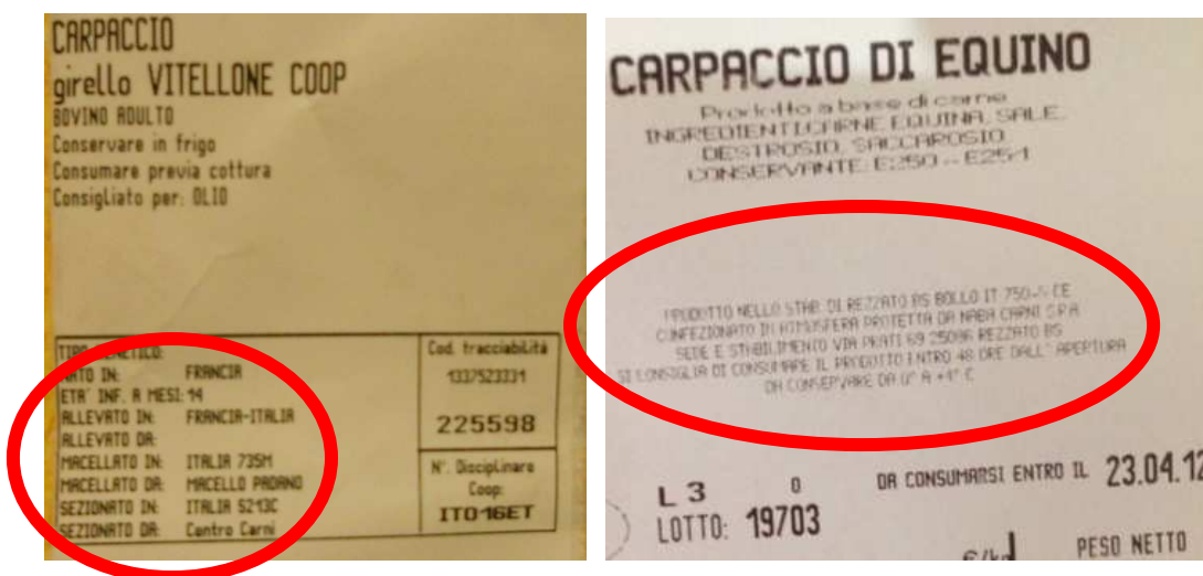
Etichetta Bovino con tracciabilità

Sull'etichetta applicata alla confezione della carne bovina si trovano tutte le informazioni necessarie per risalire all'allevamento e all'animale stesso. Mentre spesso nelle carni di cavallo le etichette sono prive di alcun tipo di informazioni.